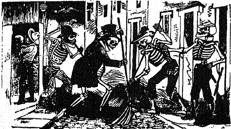
A drawing by Jose Guadalupe Posada from "Monografía"